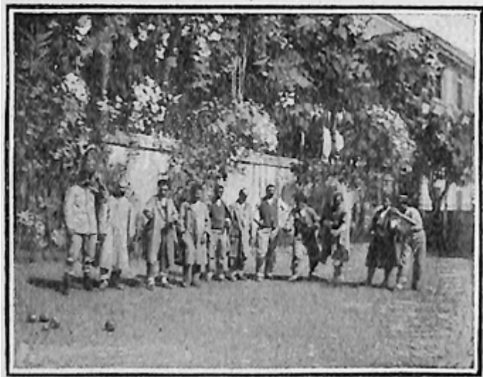
Il primo ritrovo.